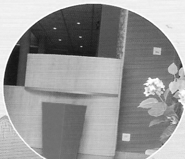
Pour les 10 ans, rénovation du hall...

Programme à disposition dans ce bulletin ainsi qu'en mairie et à l'Office de tourisme et sur le site de la mairie : www.mairie-saintlyphard.fr